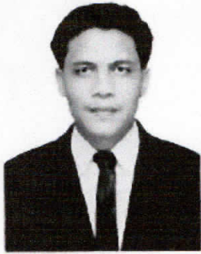
Tidak Memakai Peci