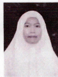
Wajah Buram, Warna Baju Kusam