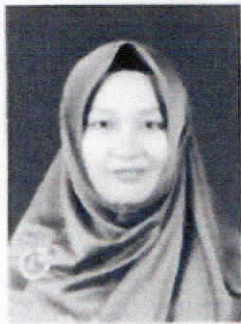
Tidak Memakai Baju Putih, Jilbab Hitam, Memakai Aksesoris