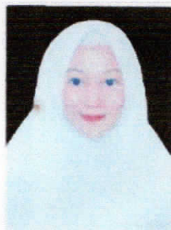
Wajah Memerah dan Jilbab Berwarna