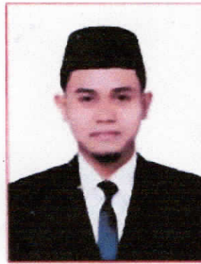
Wajah Memerah, Ada Garis Merah Pada Pinggir Foto