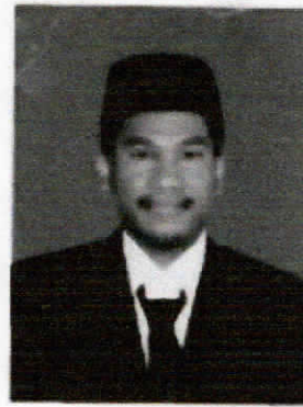
Baground Hitam Foto Gelap