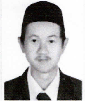
Terlalu Dekat Dengan Kamera, Bidang Dada Tidak Terlihat