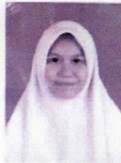
Wajah Buram, Warna Baju Kusam